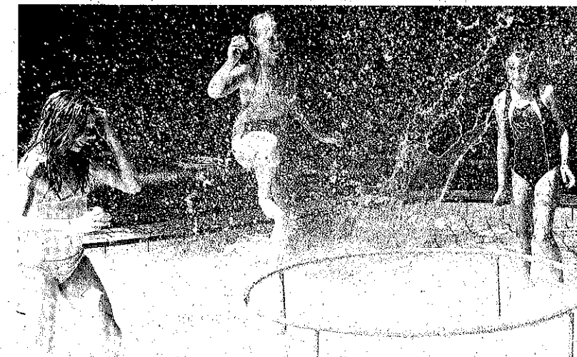
Sommer, Sonne und Wasser gehören einfach zusammen – das wurde bei der Veranstaltung am Sonnabend deutlich.

linger Freibad ist für die Kinder im Sommer ein beliebter Treffpunkt und ich würde es schade